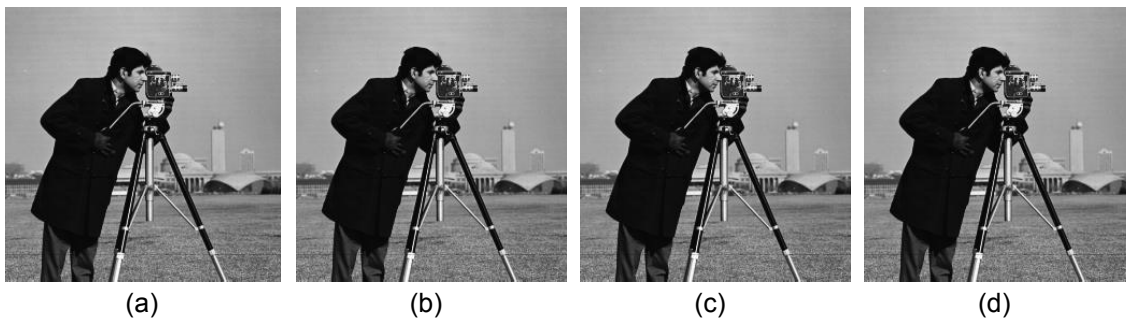
Gambar 2. Contoh gambar yang dapat dilihat dengan jelas

Persamaan matematika harus ditulis menggunakan equation tools , bukan dalam bentuk gambar. Persamaan matematika disajikan di tengah ( center alignment ), ditempatkan langsung setelah dikutip dalam teks, dan diberi nomor sesuai dengan urutan penampilan mereka di teks utama.