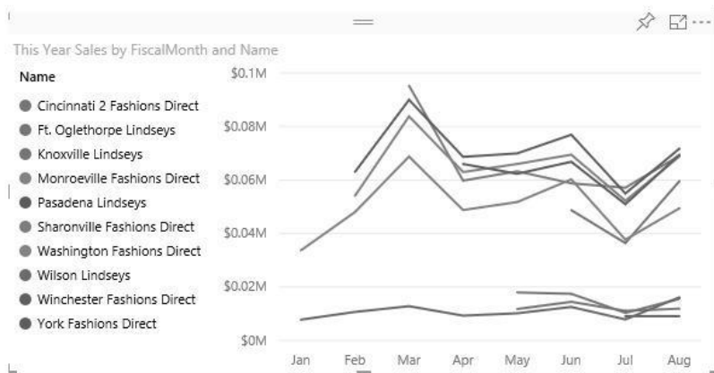
(b). Garis-garis dalam grafik tidak dapat dibedakan dengan jelas Gambar 1. Contoh gambar yang tidak bisa dilihat dengan jelas

Persamaan matematika harus ditulis menggunakan equation tools , bukan dalam bentuk gambar. Persamaan matematika disajikan di tengah ( center alignment ), ditempatkan langsung setelah dikutip dalam teks, dan diberi nomor sesuai dengan urutan penampilan mereka di teks utama.