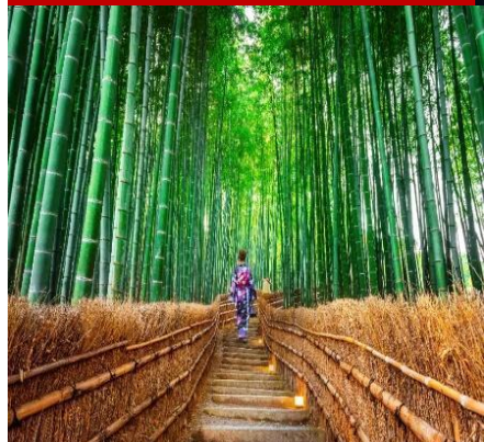
Rừng trúc Arashiyama