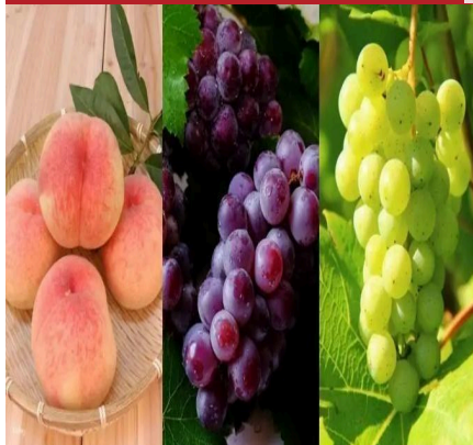
Hái trái cây tại vườn