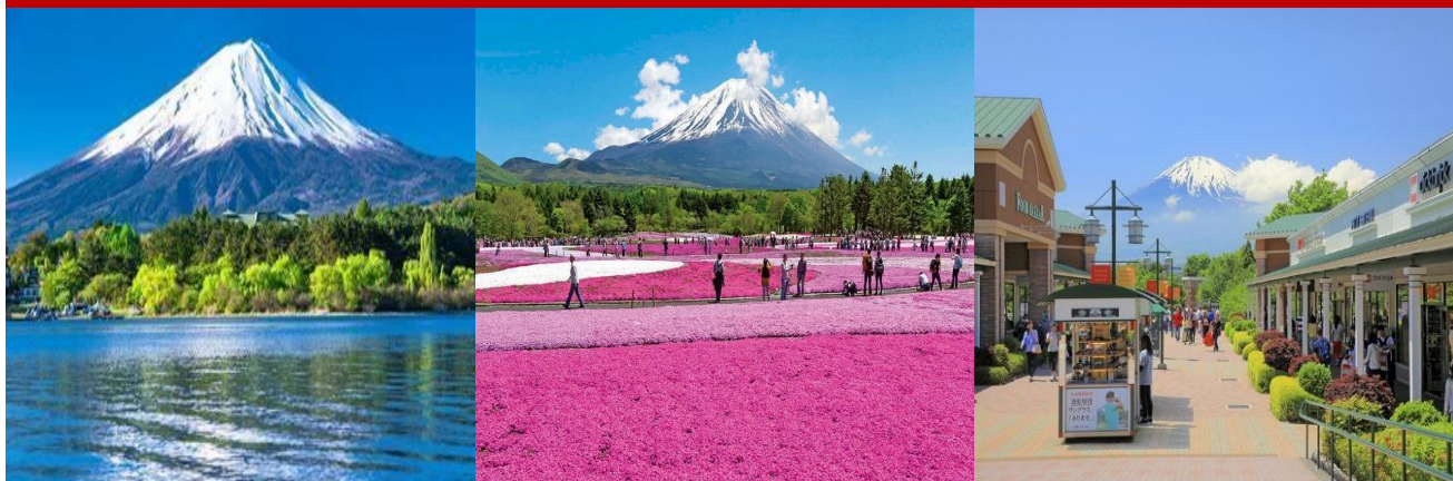
Núi Phú Sĩ