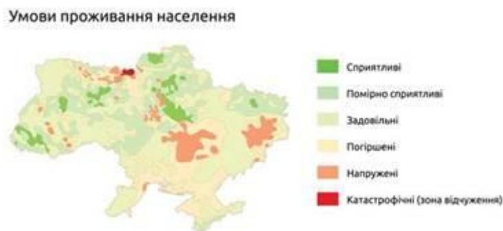
Рис. 170. Екологічна ситуація в Україні

Отже, екологічні проблеми мають соціально-економічне підґрунтя. Огляд світової екологічної ситуації це наочно підтверджує. Людина не лише стихійно впливає на навколишнє середовище через результати своєї господарської діяльності, а й змінює його відповідно до своїх потреб.