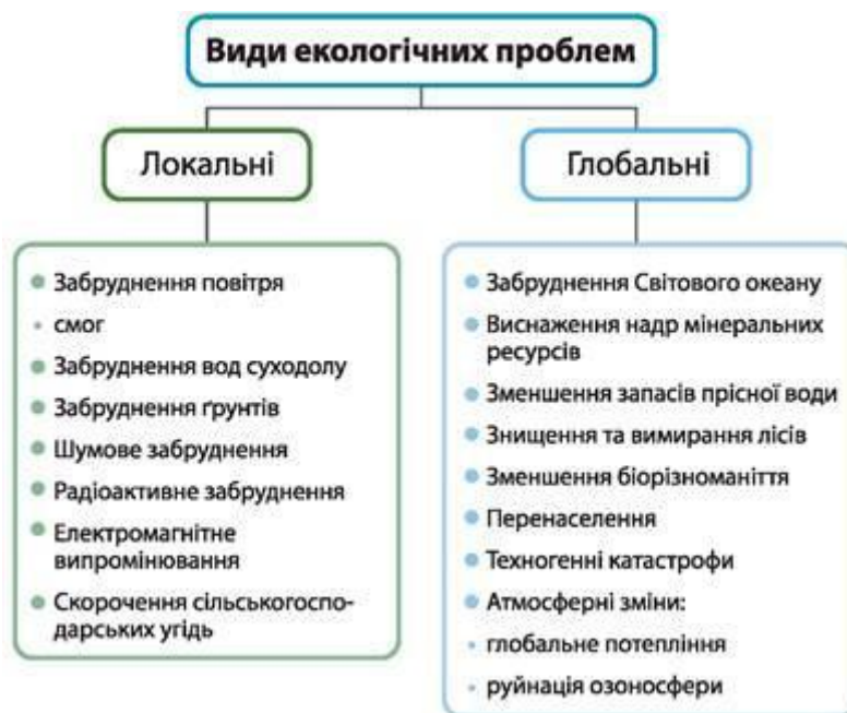
Рис. 167. Глобальні та локальні екологічні проблеми

Можна виокремити такі групи екологічних проблем: