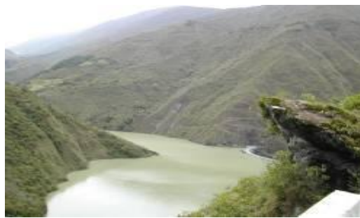
Río Santo Domingo

De la primera podemos mencionar el Chama, Mucujepé, Torondoy, Capazón, Torbes, Motatán, Monay, Escuque y Carache.