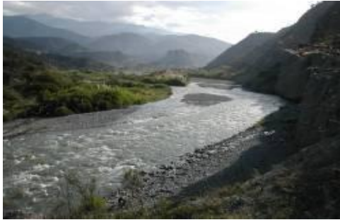
Río Chama, después de Mérida

Como todos los ríos de montaña, los de esta región no son la excepción, no son navegables, correntosos y de corto recorrido. Vierten sus aguas a dos ollas hidrográficas; A la del Caribe a través del lago de Maracaibo y a la del Orinoco, a través del río Apure.