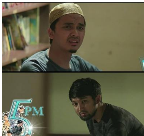
Gambar 1. Film 5 Penjuru Masjid