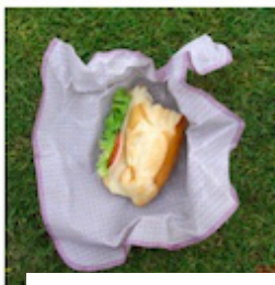
Un sandwich dans un tissu