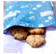
Des biscuits dans un sac en tissu