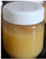
Une compote dans un pot réutilisable