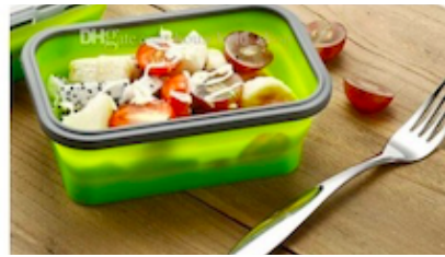
Une salade dans une boîte avec des couverts classiques