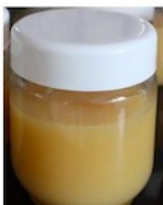
Une compote dans un pot réutilisable