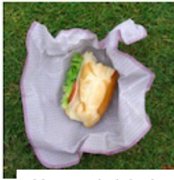
Un sandwich dans un tissu