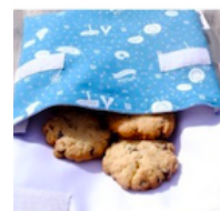
Des biscuits dans un sac en tissu