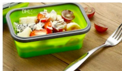
Une salade dans une boîte avec des couverts classiques