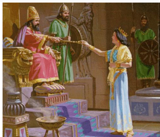
Демонстрируются иллюстрации Давид и