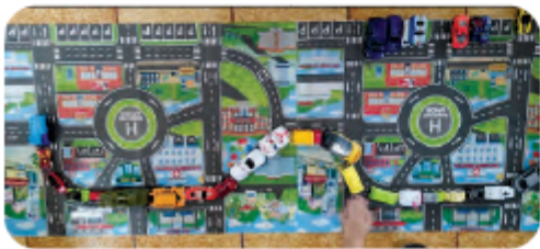
Gambar 4.12.3 Contoh Denah Kota