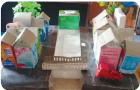
Gambar 4.12.2 Model Kota Dari Bahan Bekas

Bangunlah model sebuah kota bersama kelompokmu.