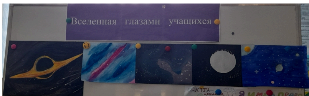
Астрономическая выставка «Вселенная глазами учащихся»