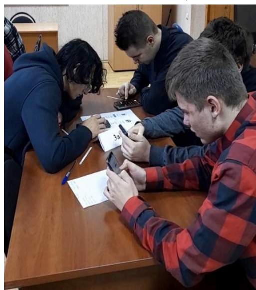
Учащиеся 3а-24 группы