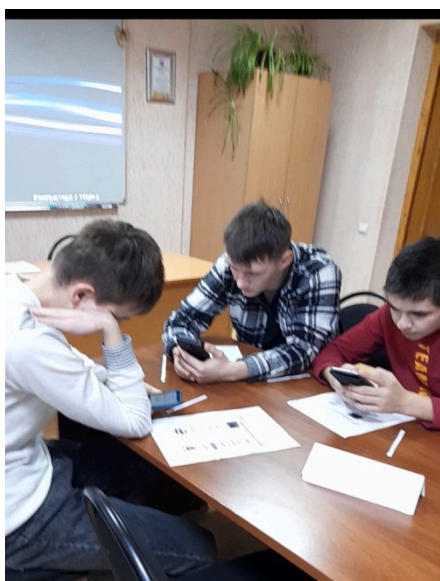
Учащиеся 13э-24 группы