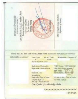
Ảnh trang chính hộ chiếu (Trang 2 và 3) Yêu cầu : Ảnh nét, rõ ràng, ko bị mất góc, ko bị mờ, ko bóng.