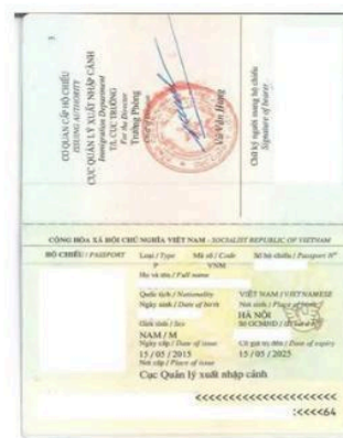
Ảnh chân dung

Yêu cầu : Ảnh nét, rõ ràng, ko bị mất góc, ko bị mờ, ko bóng.