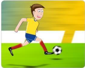
Figura 1. Escribamos oraciones