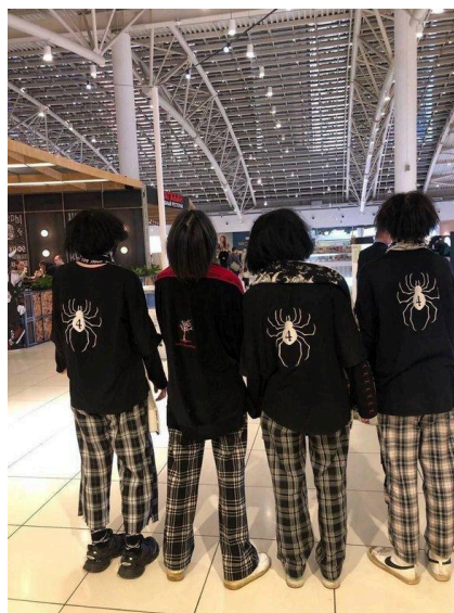
Несовершеннолетние, относящие себя к ЧВК «Редан»

Отличительной особенностью подростков субкультуры, является черная одежда с изображениями паука и цифры 4 и клетчатые штаны. Цифра 4 на пауке – созвучие японскому слову «смерть».