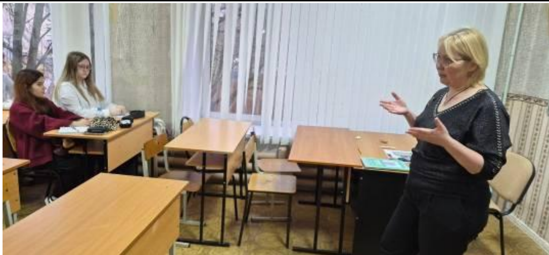
Обсудили цифровую безопасность и ее правовые основы