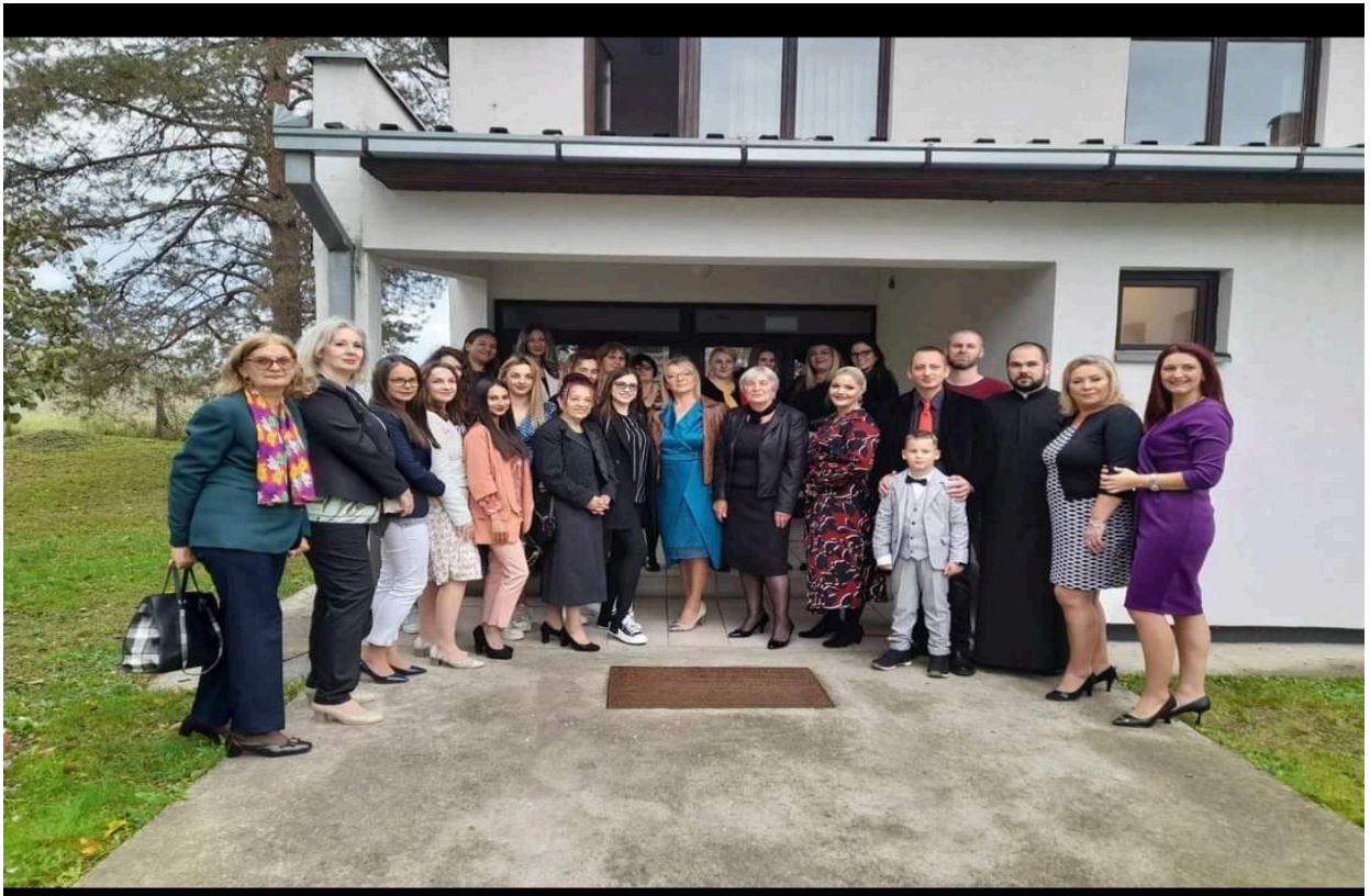
Колектив основне школе „Душан Даниловић“