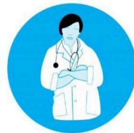
Acudir al médico en caso de tener fiebre, tos o dificultad para respirar