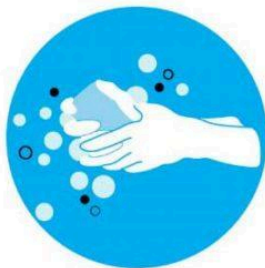
Lavarse las manos frecuentemente con agua y jabón o con un desinfectante que contenga alcohol

LAVA TUS MANOS, TUS MANOS, TÚ Y TUS AMIGOS ESTARÉIS MÁS SANOS (BIS)