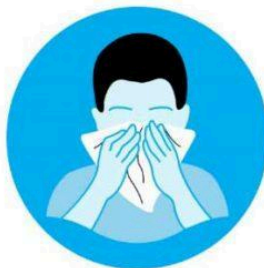
Taparse la boca y la nariz con el codo flexionado o con un pañuelo al toser o estornudar y desechar el pañuelo en una basura cerrada