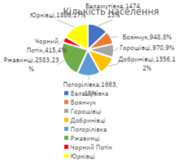
Рисунок 2. Структура населення громади