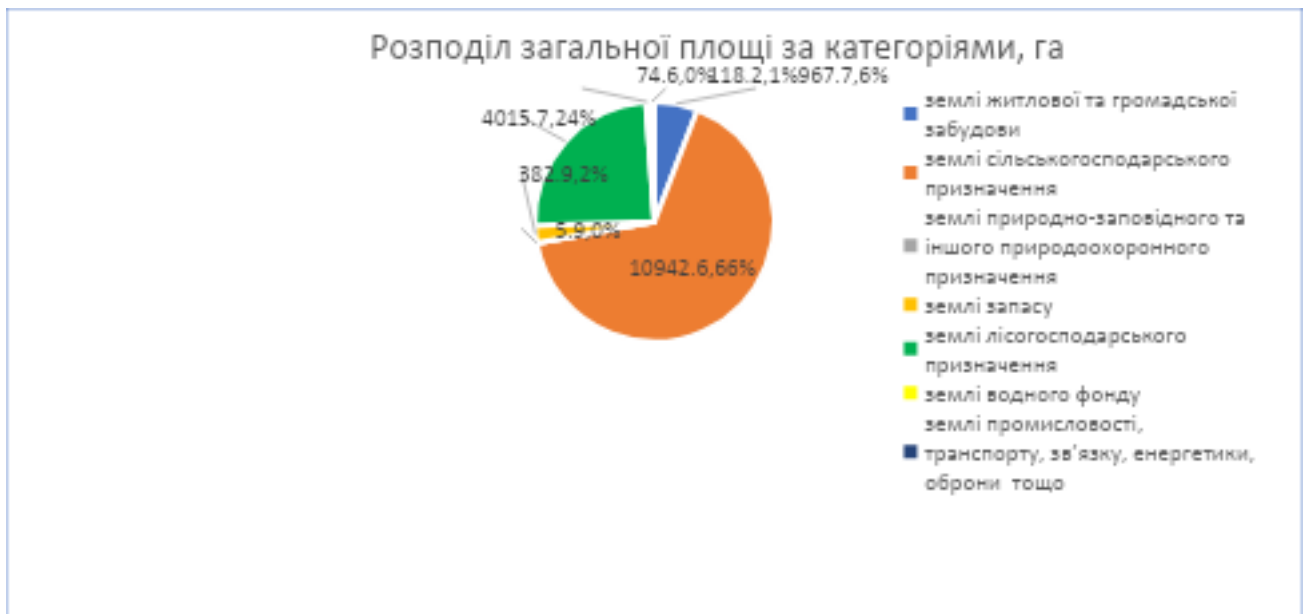
Структура земельної площі громади