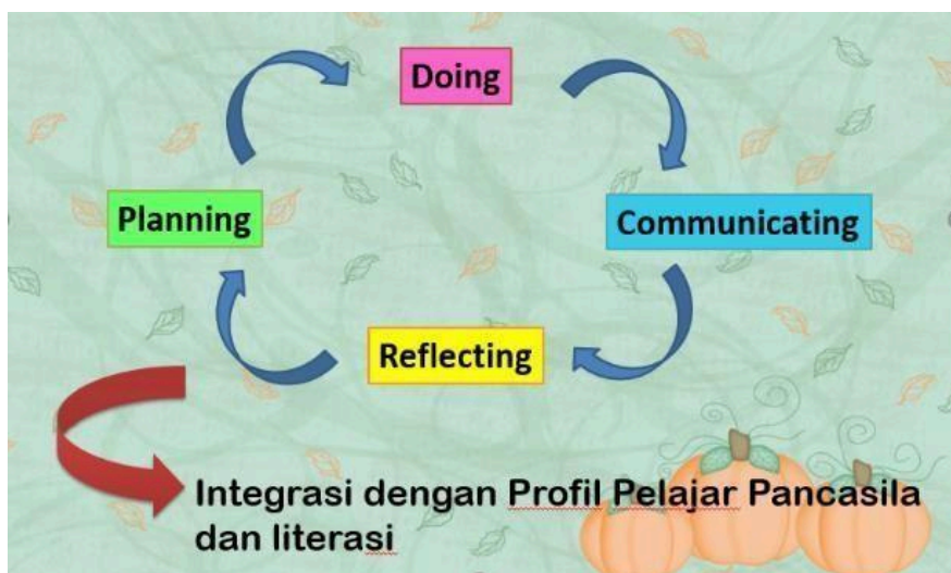
Gambar 2. Alur Pelaksanaan Pembelajaran

jadwal pembelajaran mingguan, namun catatan refleksi menjadi tambahan dalam kegiatan pembelajaran selanjutnya.