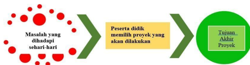
Gambar 3. Karakteristik Pembelajaran Berbasis Proyek

Pembelajaran berbasis proyek untuk penguatan Profil Pelajar Pancasila diselaraskan dengan potensi lokal yang menjadi ciri khas satuan pendidikan, capaian Satuan Pendidikan pembelajaran, dapat mengakomodir keragaman minat bakat peserta didik dan mampu mengembangkan kecakapan hidup peserta didik. Penguatan Profil Pelajar Pancasila terdiri dari enam dimensi yaitu beriman, bertakwa kepada Tuhan Yang Maha Esa dan berakhlak mulia, berkebhinekaan global, gotong royong, mandiri, bernalar kritis dan kreatif.