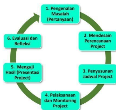
Gambar 4. Langkah-langkah pembelajaran berbasis proyek

Dalam membuat rancangan pembelajaran berbasis proyek terdapat langkah-langkah yang harus disusun secara bertahap mulai dari mengidentifikasi masalah dengan pertanyaan pemicu yang diambil dari permasalahan kontekstual implementasi Profil Pelajar Pancasila kemudian merancang proyek secara kolaboratif antara guru dan peserta didik disertai program penjadwalan yang disepakati, setelah itu dilanjutkan ke tahap pelaksanaan. Di bagian akhir ada presentasi hasil yang akan dievaluasi dan kemudian menjadi refleksi untuk perbaikan.