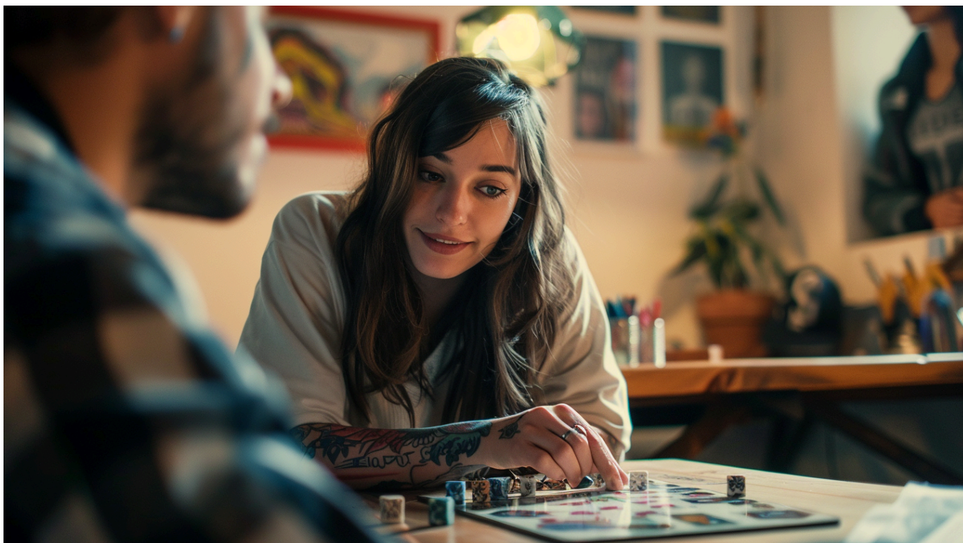
Чем можно заняться в тату-салоне

Если вы и ваш мастер любите поболтать, то это также может сыграть на руку, поскольку беседа, как правило, отвлекает от происходящего вокруг.