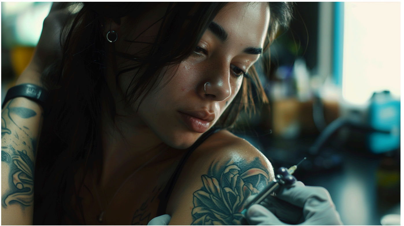
Ощущения при нанесении тату