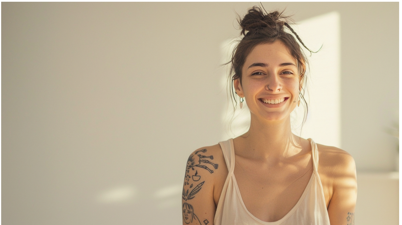
Тату сразу после нанесения