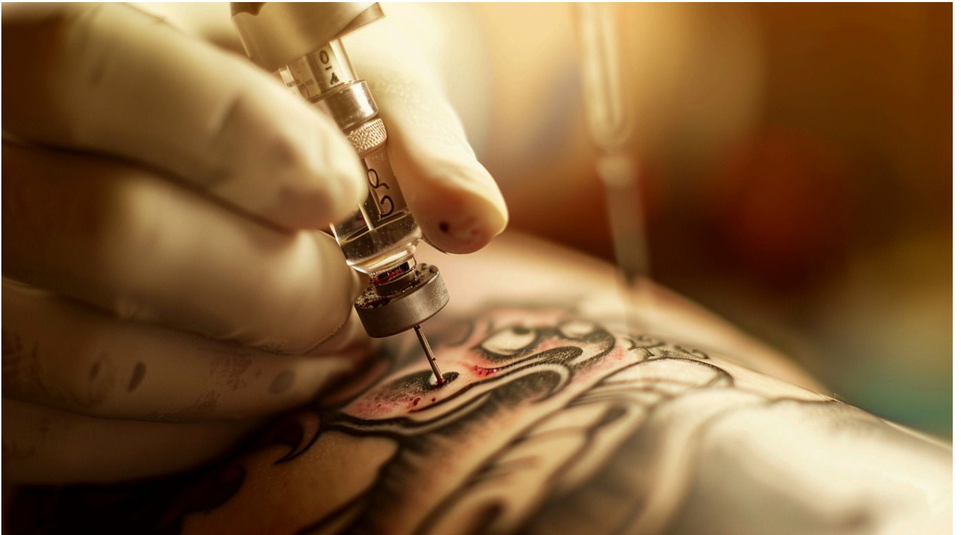
Процесс нанесения татуировки

что для закраса и теней используются «пучки» игл, кожа сильнее травмируется, чем при нанесении контура.