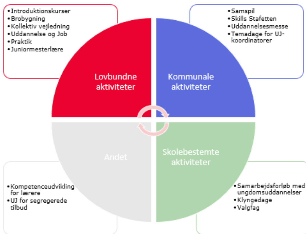
Figur 2 – Alle vejledningsaktiviteter

Udover de lovbundne vejledningsaktiviteter såsom brobygning og kollektiv vejledning, er der også iværksat flere kommunale og skolebestemte aktiviteter, hvilket illustreres i nedenstående figur 2: