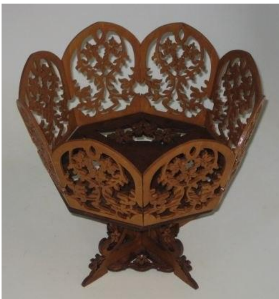
Декоративна ваза № 2

https://drive.google.com/file/d/1yDTI9gVOHQFopMnTnfELx6l-M-WiZD1M/view?usp=sharing