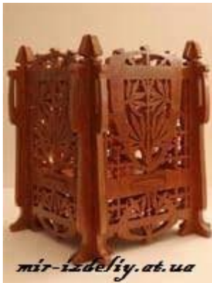
Декоративна ваза № 1

https://drive.google.com/drive/folders/1bzh125I84HnVdDtB35L2UMB39BqPuTGI?usp=sharing