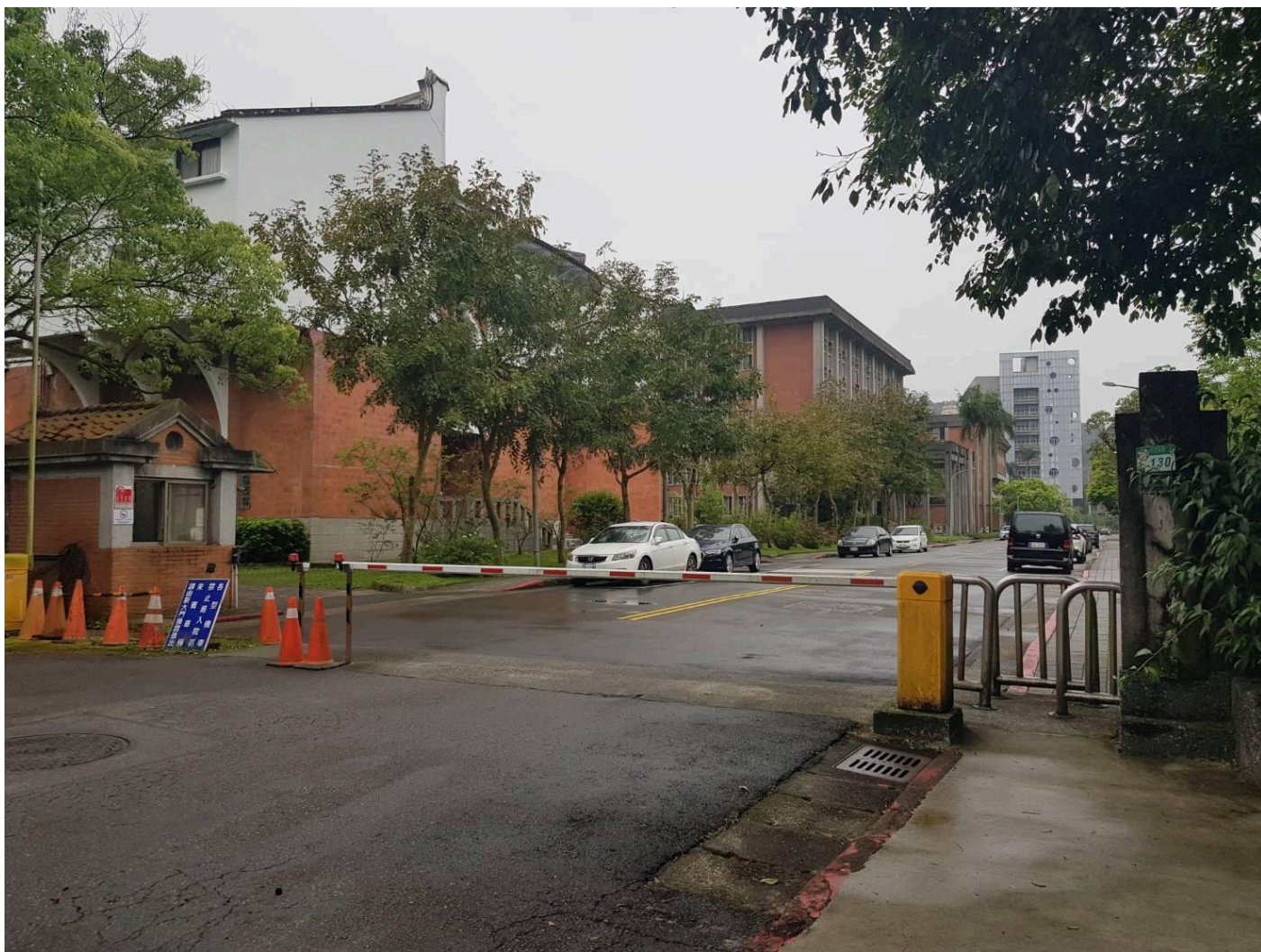
胡適公園和中研院相對位置：