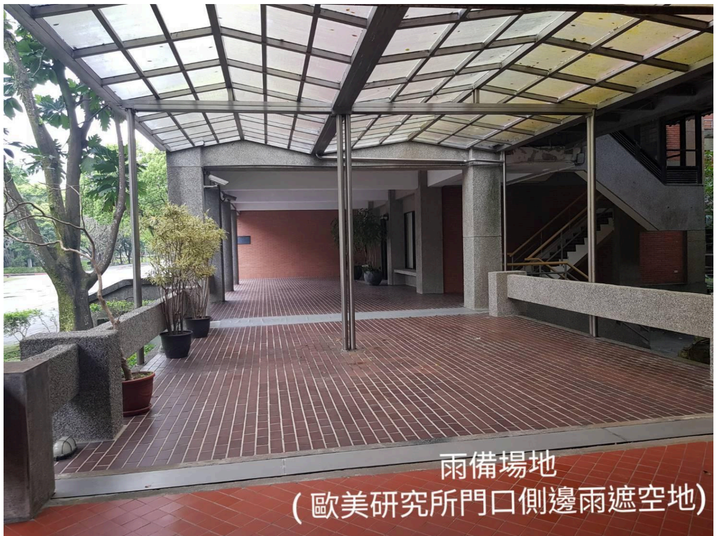
雨備場地 (歐美研究所門口側邊雨遮空地)