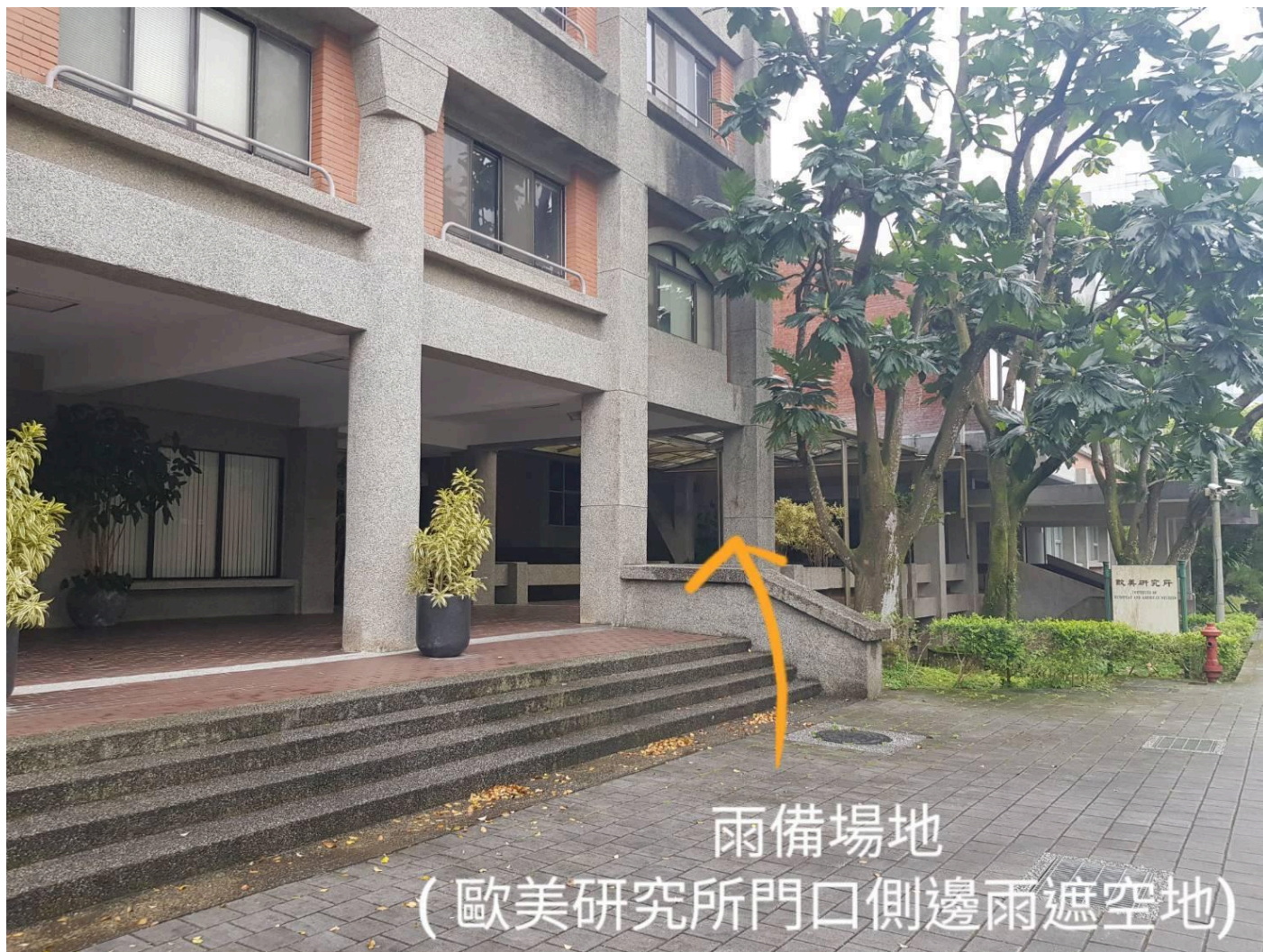
雨備場地 (歐美研究所門口側邊雨遮空地)