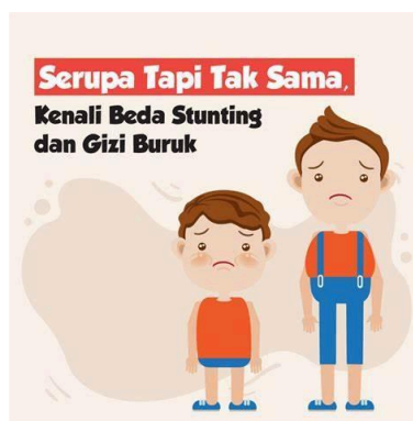
Gambar 1. Balita stunting