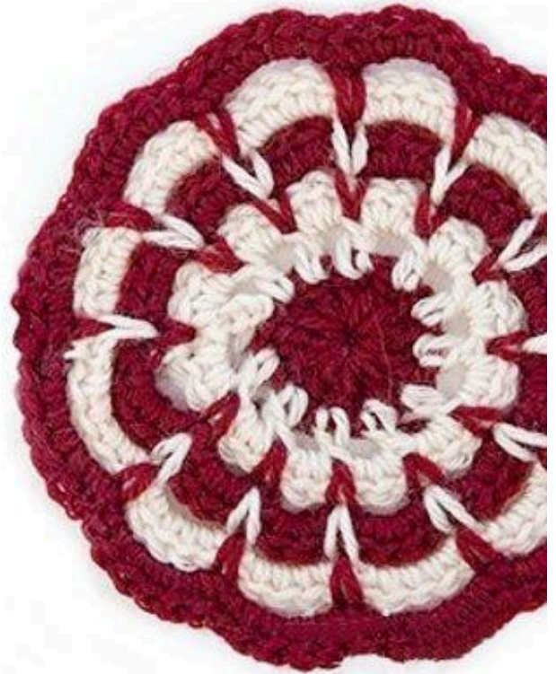
Схема в'язання мотиву: