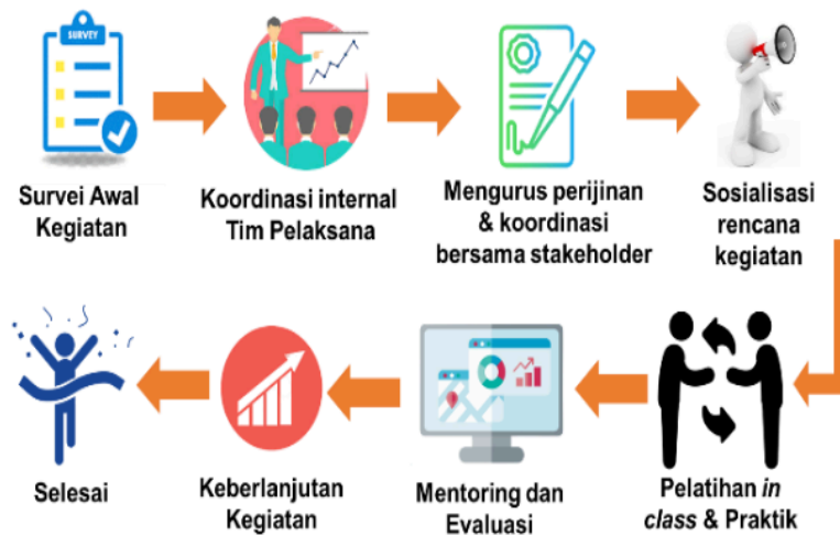
Gambar 2. Size 10, Book Antiqua, Italic Center

Temuan ilmiah yang dimaksud di sini bukan data-data hasil pengabmas yang diperoleh. Temuan-temuan ilmiah tersebut harus dijelaskan secara saintifik, meliputi: Apakah temuan ilmiah yang diperoleh? Mengapa hal itu bisa terjadi? Mengapa tren variabel seperti itu? Semua pertanyaan tersebut harus dijelaskan secara saintifik, tidak hanya deskriptif, bila perlu ditunjang oleh fenomena-fenomena dasar ilmiah yang memadai. Selain itu, harus dijelaskan juga perbandingannya dengan hasil-hasil para pengabmas/peneliti lain yang hampir sama topiknya. Hasil-hasil temuan/kemajuan/perubahan sosial dan lainnya harus bisa menjawab tujuan pengabmas di bagian pendahuluan.