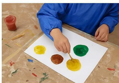
Figura 1 - Atividade de experimentação com tintas naturais