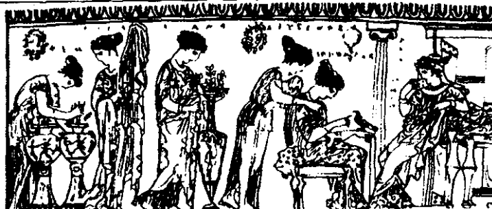
Мал.4 Оформлення вази з квітами в Стародавній Греції. Vст. до н. е.

зберегли сліди своїх давніх свіжих фарб. В той же час за допомогою виражали різні почуття. Навіть деякі боги єгиптян були втілені у рослини.