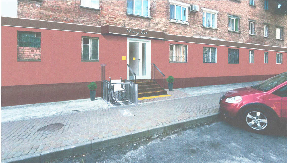
СХЕМА БЛАГОУСТРОЮ ПРИЛЕГЛОЇ ТЕРИТОРІЇ