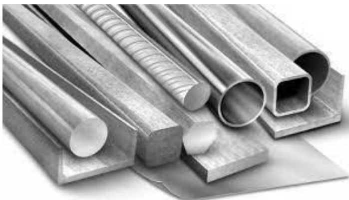
Мал. 3. Алюміній