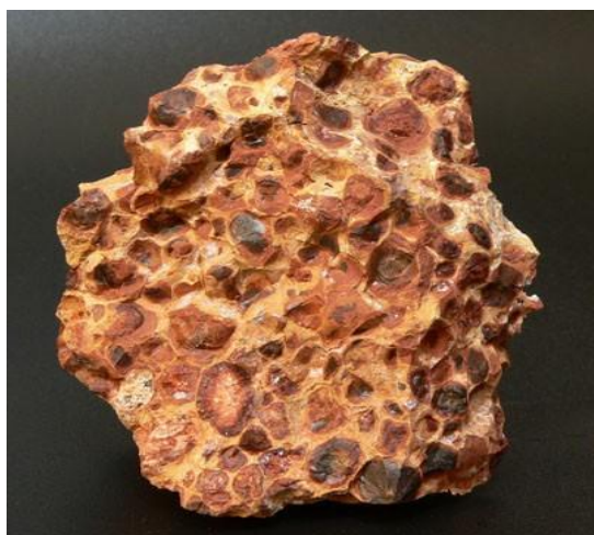
Мал. 1. Боксит

Алюмінієва промисловість — галузь кольорової металургії, на підприємствах якої з алюмінієвих руд (переважно бокситів) (мал. 1) одержують глинозем (мал. 2) і далі шляхом електролізу — алюміній. (мал. 3)