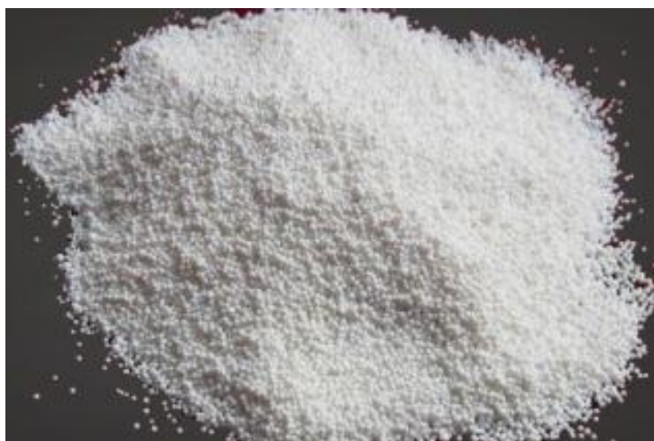
Мал. 2. Глинозем