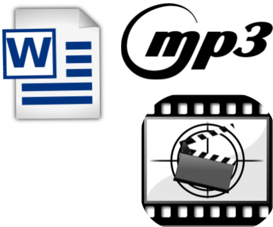
Imagen de word extraída de

http://pixabay.com/es/documento-de-word-documento-texto-150594/ con Licencia de Dominio Público http://creativecommons.org/publicdomain/zero/1.0/deed.es