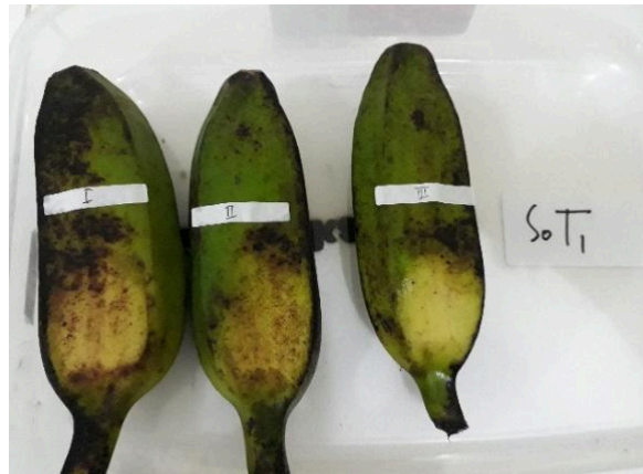
Gambar 1. Perlakuan penyimpanan pisang pada suhu dingin

akan tetapi langsung merujuk ke nama gambar, (misal: “pada Gambar 1”).