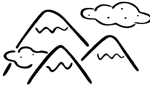
Gambar 2. Keterangan tentang Gambar

Judul tabel harus dipusatkan di atas tabel.