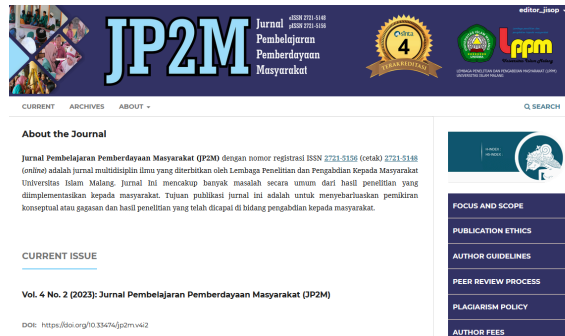
Gambar 1. Judul Gambar (font cambria 8 pt, 1 spasi)

judul gambar hanya diperkenankan memuat satu gambar saja. Contoh: penjelasan mengenai teknis penulisan dan submit jurnal JP2M terpapar seperti pada Gambar 1. Perhatikan format penulisan caption gambar/grafik berikut ini: