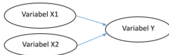
GAMBAR 1. KERANGKA PIKIR PENELITIAN

Contoh gambar kerangka pikir penelitian dalam 1 kolom dapat dilihat pada gambar 1. Jika gambar tidak cukup dalam 1 kolom maka harus diletakkan di bagian bawah halaman yang membahas gambar tersebut, contoh dapat dilihat pada gambar 2.