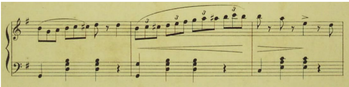
Figura 1. A borboleta (c. 8-10)

Solicita-se a elaboração e inserção das descrições das imagens apresentadas no corpo do texto, com o objetivo tornar acessível a leitura de elementos visuais junto a todos os públicos e especificamente, às pessoas com deficiência visual, mediante o uso de softwares leitores de telas. Esclarece-se que esses elementos não serão contabilizados no dimensionamento do artigo, e que, após a edição final, serão incorporados ao campo Alt Text, tornando-se embutidos nas respectivas figuras.