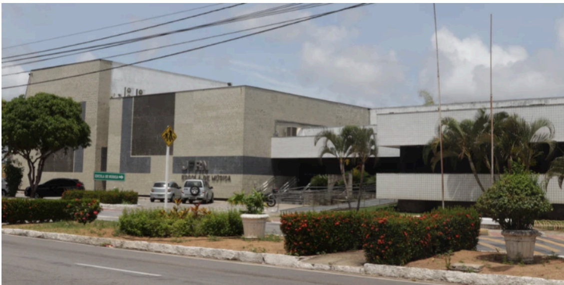
Figura 2. Sede da Escola de Música da UFRN, Campus Universitário, Natal/RN.