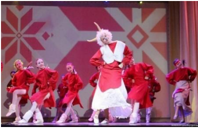
Танец "Каляды". Рэспубліканскі конкурс "Здравствуй, мир!"

Выніковым мерапрыемствам стала фальклорнае свята "Пастаўская шчадровіца", на якое былі запрошаны навучэнцы ўсіх аб'яднанняў па інтарэсах Цэнтра, педагогі, бацькі, прадстаўнікі грамадскасці. Творчыя работы, створаныя падчас вывучэння скразной тэмы "Як святкуюць Каляды", былі прадстаўлены на конкурсах "Калядная зорка", "Нашчадкі традыцый", "Здравствуй, мир", на раённых мерапрыемствах.