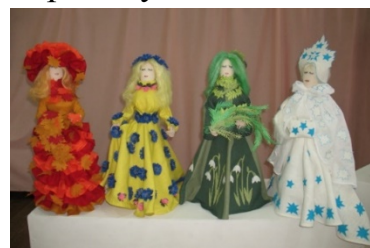
Калекцыя лялек "Феі года"

Задачамі вывучэння скразной тэмы "Казачныя персанажы і вобразы беларускай міфалогіі, якія ўвасабляюць поры года" было не толькі пазнаёміць з персанажамі і вобразамі беларускай міфалогіі, але і распрацаваць аўтарскае бачанне персанажаў. У працэсе вывучэння тэмы навучэнцы аб'яднання па інтарэсах "Рэлак" і студыі выяўленчага мастацтва "Сяміцветкі" падрыхтавалі прэзентацыю "Поры года ў тварах", навучэнцы аб'яднання па інтарэсах "Юныя дызайнеры" стварылі калекцыю лялек. Навучэнцы аб'яднанняў па інтарэсах музычна-харэаграфічнага напрамку знайшлі і развучылі песні па тэме, падрыхтавалі харэаграфічныя кампазіцыі.