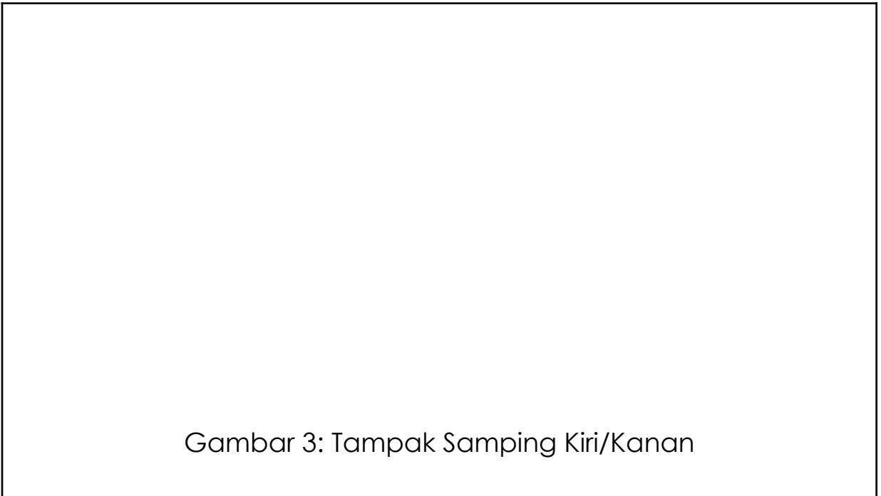
Gambar 3: Tampak Samping Kiri/Kanan