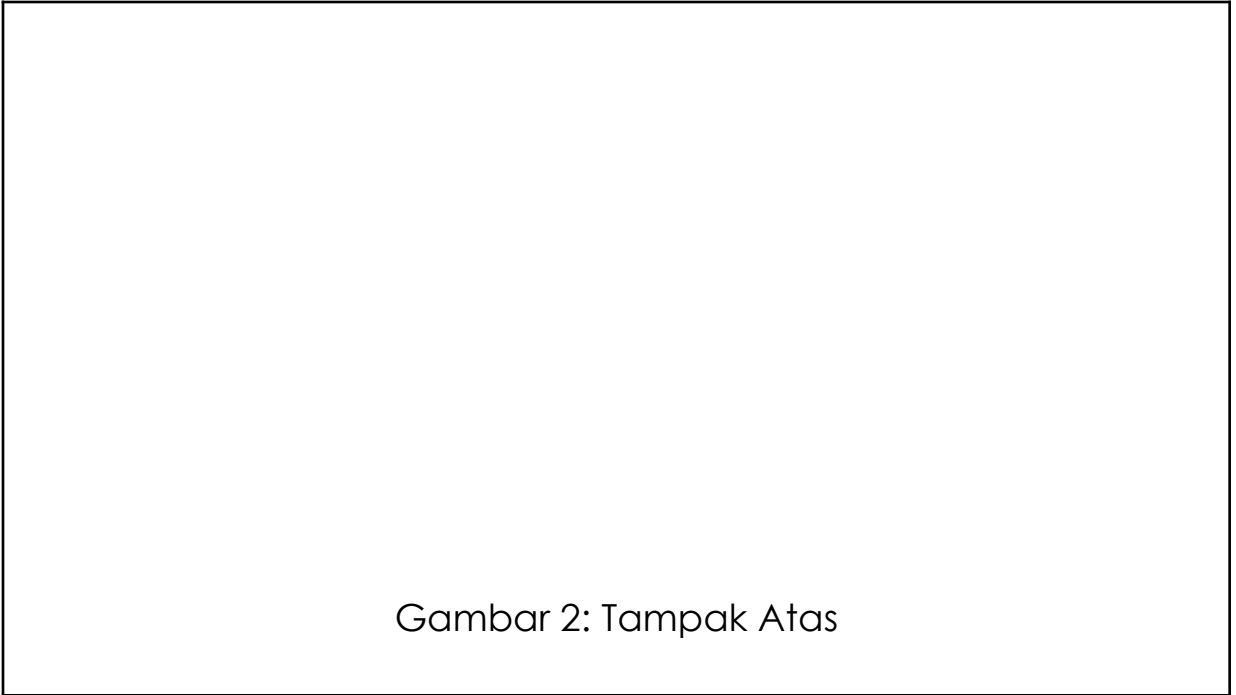
Gambar 2: Tampak Atas