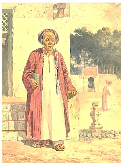
Gambar 1. Contoh gambar atau foto