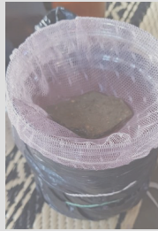
Gambar 1. Ecovitraps dalam rumah