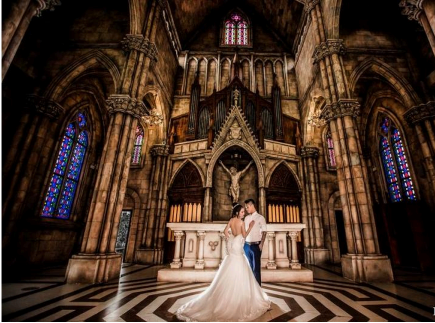
Fix Studio Wedding