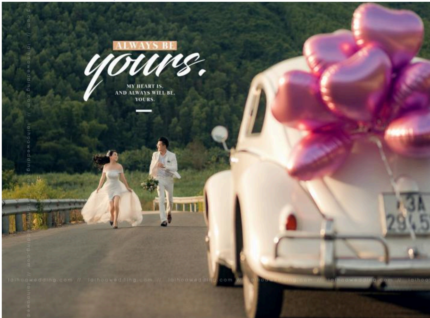
Lai Hoa Wedding