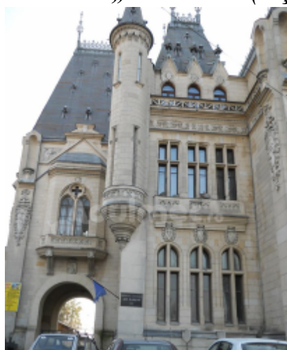
Повітова бібліотека ім. Г. Асакі (Ясси, Румунія) Biblioteca județeană „G. Asachi” (Iași, România)