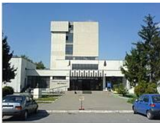
Технічний університет ім. Г. Асакі (Ясси, Румунія) Universitatea tehnică „G. Asachi” (Iași, România)