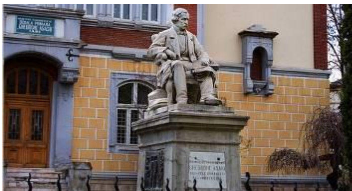
Початкова школа ім. Г. Асапі (Ясси, Румунія) Școala primară „G. Asachi” (Iași, România)