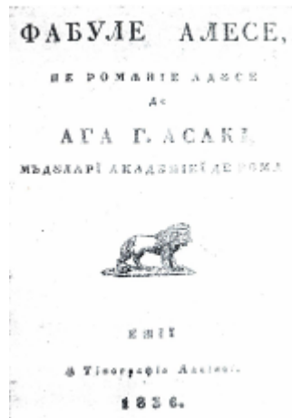
Титульна сторінка «Вибрані байки» Ага. Г. Асакі (1836) (Ясси, Румунія) Foaie de titlu „Fabule alese” Ага. G. Asachi (1836) (Іаși, România)