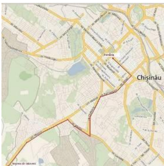
Вулиця «Г. Асакі» (Кишинів, Молдова) Strada „G. Asachi” (Chișinău, Moldova)