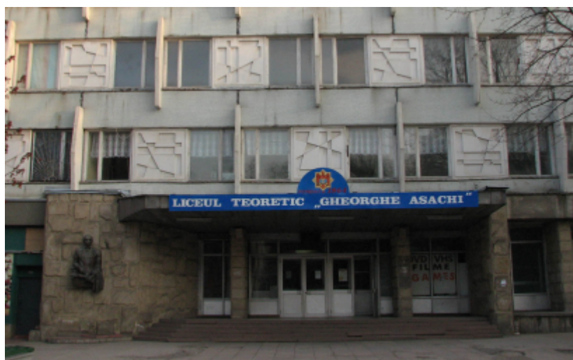
Теоретичний ліцей ім. Г. Асакі (Ясси, Румунія) Liceul teoretic „G. Asachi” (Iași, România)