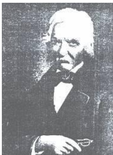
Г. Асакі на старості літ