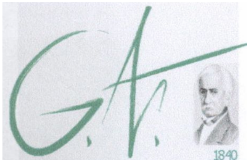
Автограф Г. Асакі Autograful lui G. Asachi