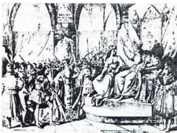
Картина «Штефан Великий проголошує свій політичний акт в 1504» Tablou „Ștefan cel Mare a Moldovei cuvântează al său testament politic în anul 1504”