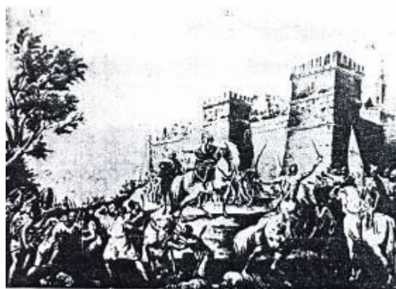
Картина «Мати Штефана Великого заважає сину потрапити до Фортеці Няміц 1484» (1833) Tablou „Mama lui Ștefan cel Mare împiedică pe fiul său de a intra în Cetatea Neamț în 1484” (1833)