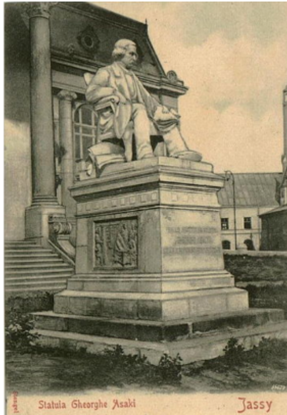
Пам'ятник Г. Асаки (Ясси, Румунія) Statuia G. Asachi (Iași, România)