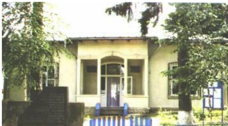
Центральна районна бібліотека ім. Г. Асакі (м. Герца, Україна) Biblioteca centrală raională în numele lui G. Asachi (or. Herța, Ucraina)