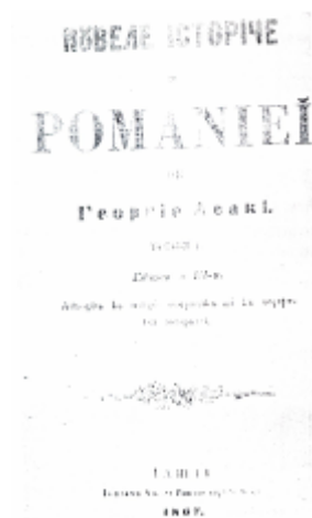
Титульна сторінка «Історичні румунські новели» Г. Асакі (1867) (Ясси, Румунія) Foaie de titlu „Nuvele istorice a României” de G. Asachi (1867) (Іаși, România)