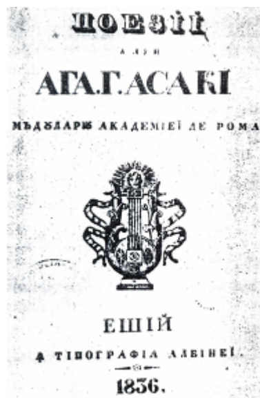
Титульна сторінка книги «Вірші» Ага. Г. Асаки (1836) (Ясси, Румунія) Foaie de titlu a cărții „Poiezii” Aga. G. Asachi (1836) (Iași, România)