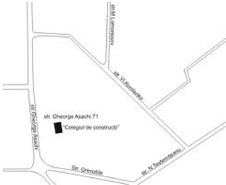
Булиця «Г. Асакі» (Ясси, Румунія) Strada „G. Asachi” (Iași, România)