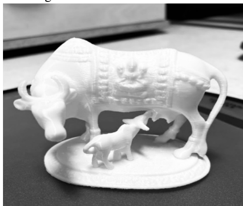
3D Design of a Cow and a Calf

The cow symbolizes motherly devotion, nurturance, and divine grace , representing the earth's unconditional love, just as Mirabai's devotion to Krishna is pure and selfless. The calf represents the soul (jiva) , longing for divine sustenance and protection, mirroring the devotee's yearning for closeness to the sacred. Mirabai often positions herself as the calf and Krishna as the divine cowherd (Gopala) , crafting a powerful metaphor of spiritual dependency, trust, and the soul's deep longing for union with the beloved Lord.