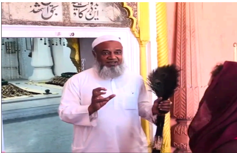
Interview with Imam at Panchakki (Water Mill) in Aurangabad, India

Activity: Students will listen to a YouTube interview at PanChakki Dargah where an imam discusses women's status in Islamic society and mosque entry rules. They will identify key points, interpret cultural and religious norms, and analyze how gender and faith intersect using contextual clues. Later on, they will ask each the following comprehension questions to know everyone's opinion.