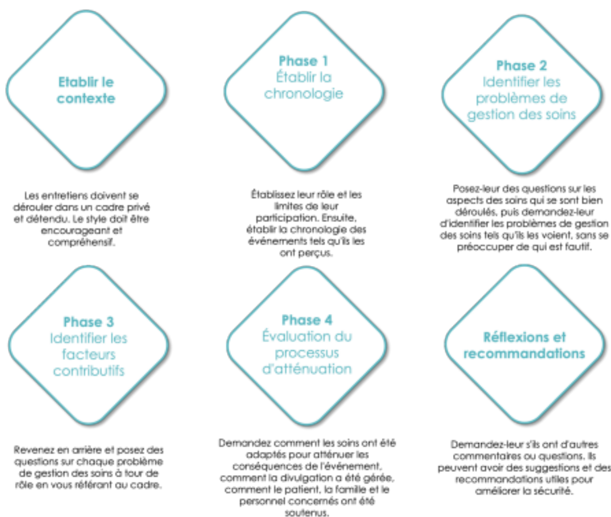
Figure 3. Processus pour mener une interview