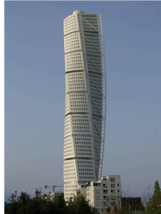
Turning Torso

De flesta moderna mobiltelefoner har accelerometrar inbyggda. Vid en hissfärd i Turning Torso uppmättes nedanstående diagram med accelerometern i en sådan mobiltelefon. Mätningen börjar när vi går in i hissen.