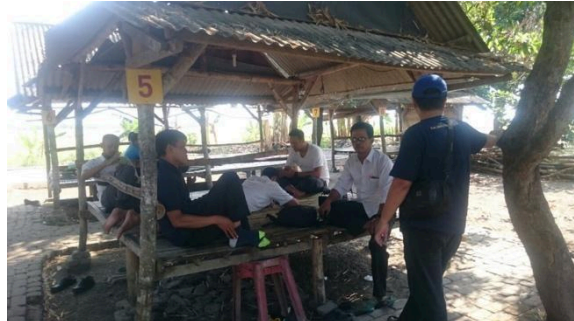
Gambar 1: Praktik Pengembangan Media Pembelajaran

Gambar ditampilkan dalam colour Grayscale dengan keterangan gambar di bawah. contoh: