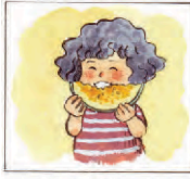
Mava suka buah melon.