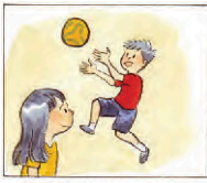
Ba u Moko merah.