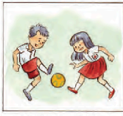
Mimi suka main bola.