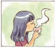
Mimi minum teh madu.

Pada kegiatan mengenali kalimat pernyataan, lakukan hal-hal sebagai berikut.