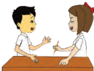
Gambar 3.1 Bermain Estafet Pensil