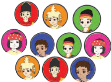
Gambar 3.7 Kartu Kelompok Ras