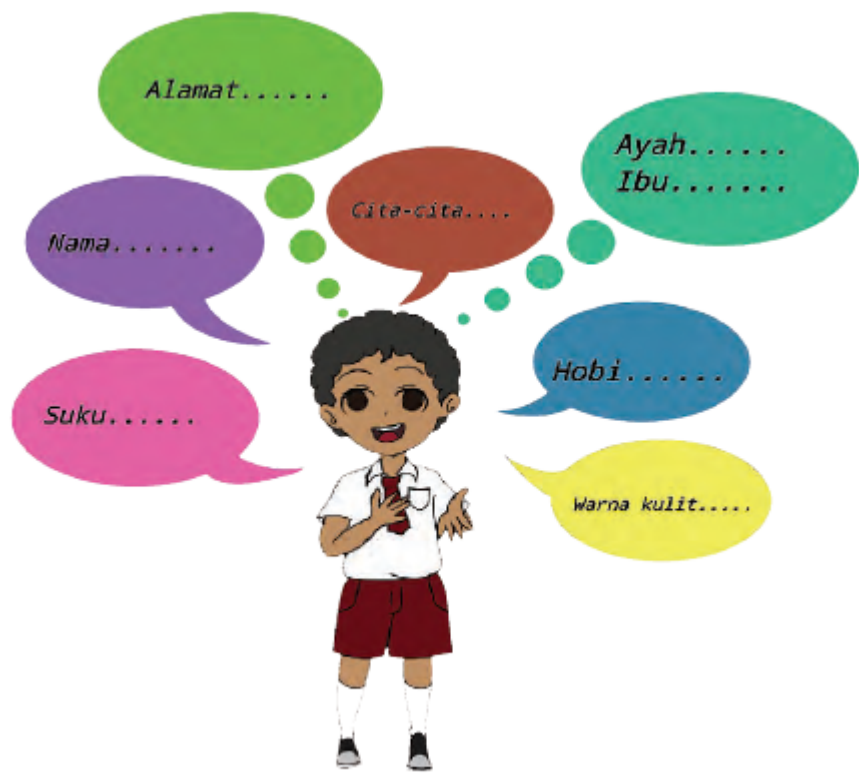
Gambar 3.4 LKPD Pembelajaran 1