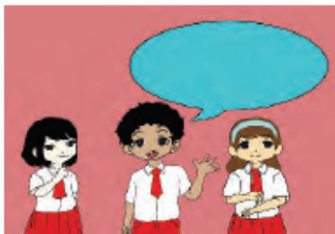
Gambar 3.2 Memperkenalkan diri