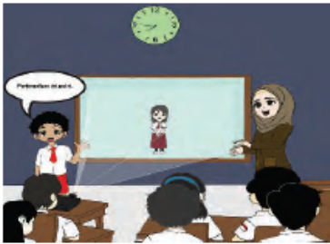
Gambar 3.5 Cara Memperkenalkan Teman

Berdasarkan unit pembelajaran yang kedua, refleksi yang dapat dilakukan dengan melihat aktivitas pembelajaran, mulai dari kegiatan guru dalam perencanaan, pelaksanaan pembelajaran, dan penilaian hasil belajar. Kegiatan refleksi pada kegiatan pembelajaran II, dapat dilakukan dengan panduan tabel 3.7 berikut ini.