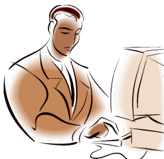
Figura 1 – Legenda da figura

XXXXXXXX XXXXX XXXXXXXXXXXXXXX XXXXXX XXXXXXXX XXXXXXXX XXXX XXXXXX XXXXXX XXXXXXXXXXXXXXX. XXXXXXXXXXXXXXX XXXXXXXXXXXXXXX XXXXXXXXXXXXXXX XXXXXXXXXXXXXXX XXXXXXXXXXXXXXX XXXXXXXXXXXXXXX XXXXXXXXXXXXXXX XXXXXXXXXXXXXXX XXXXXXXXXXXXXXX XXXXXXX XXXXXXXXXXXXXXX XXXXXXXXXXXXXXX XXXXXXXXXXXXXXX XXXXXXXXXXXXXXX. XXXXXXXXXXXXXXX XXXXXXXXXXXXXXX XXXXXXXXXXXXXXX XXXXXXXXXXXXXXX XXXXXXXXXXXXXXX XXXXXXXXXXXXXXX XXXXXXXXXXXXXXX XXXXXXXXXXXXXXX XXXXXXXXXXXXXXX XXXXXXXXXXXXXXX XXXXXXX XXXXXXXXXXXXXXX XXXXXXXXXXXXXXX XXXXXXXXXXXXXXX XXXXXXXXXXXXXXX. XXXXXXXXXXXXXXX XXXXXXXXXXXXXXX XXXXXXXXXXXXXXX XXXXXXXXXXXXXXX XXXXXXXXXXXXXXX XXXXXXXXXXXXXXX XXXXXXXXXXXXXXX XXXXXXXXXXXXXXX XXXXXXXXXXXXXXX XXXXXXX XXXXXXXXXXXXXXX XXXXXXXXXXXXXXX XXXXXXXXXXXXXXX XXXXXXXXXXXXXXX XXXXXXXXXXXXXXX XXXXXXX