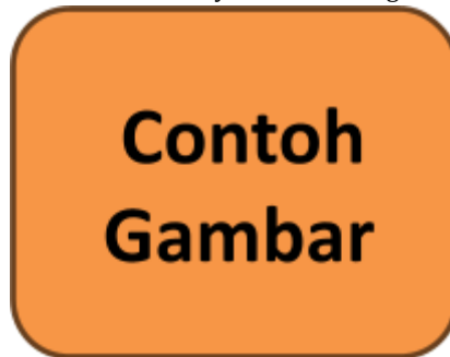
Gambar 1: Berikan Deskripsi Singkat Gambar (Sumber: Cantumkan sumber jika perlu), ditulis menggunakan font Cambria 9 pt

Sumber: tuliskan sumber datanya atau keterangan lain yang penting