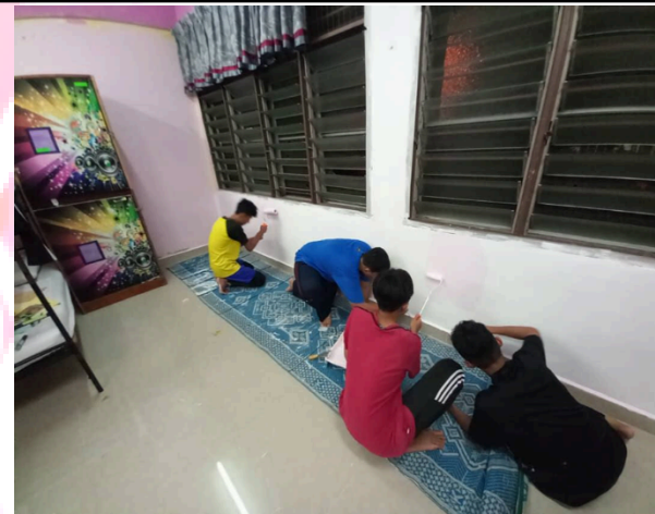
Penghuni Kamar Umar menjalankan aktiviti mengecat kamar