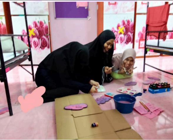
Penghuni Kamar Mashitah menjalankan aktiviti menghias kamar