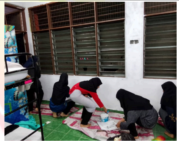
Penghuni Kamar Fatimah menjalankan aktiviti mengecat kamar