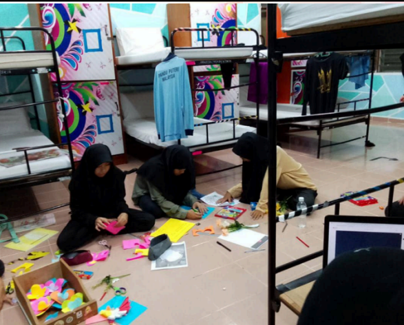
Penghuni Kamar Khadijah menjalankan aktiviti menghias kamar