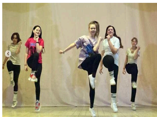
Конкурс утренней зарядки «Я танцую, я здоров» в ГУО «Средняя школа № 35 г. Витебска имени А.П. Овечкина»