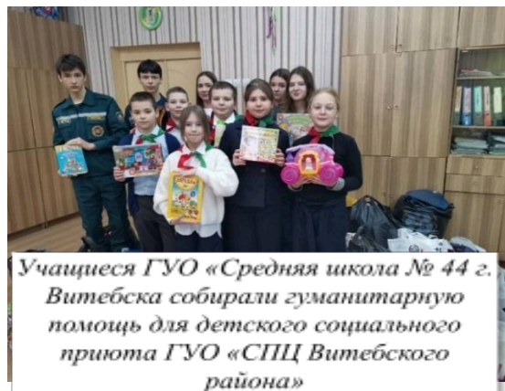
Учащиеся ГУО «Средняя школа № 44 г. Витебска собирали гуманитарную помощь для детского социального приюта ГУО «СПЦ Витебского района»

«Наше творчество городу» – заключительное направление