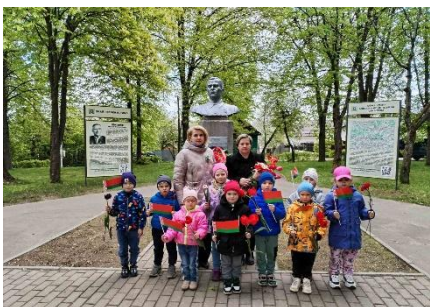
Альпийская горка ГУО «Детский сад №91 г. Витебска «Искорка»