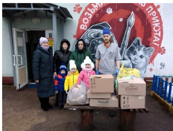
Сотрудники и воспитанники ГУО «Детский сад № 15 г. Витебска «Криничка» посетили приют для животных «Добрик»